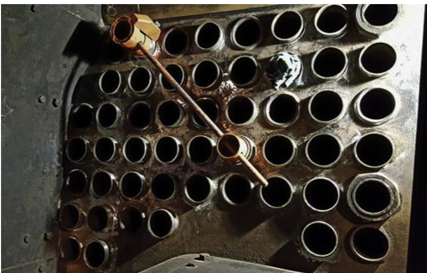
Del av pannans gavel, med ett verktyg för tubbyte anbringat