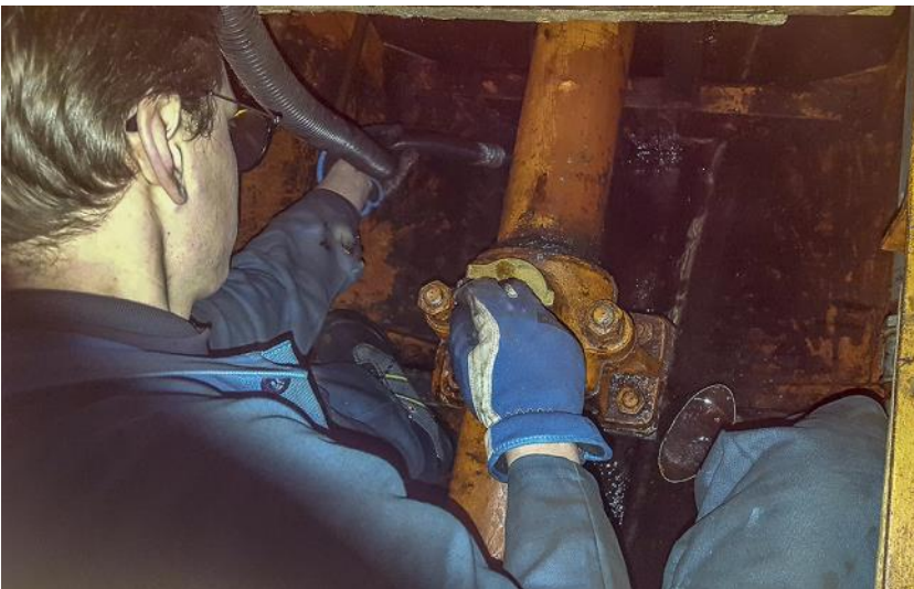
Tunneln för propelleraxeln länsas och rengöres