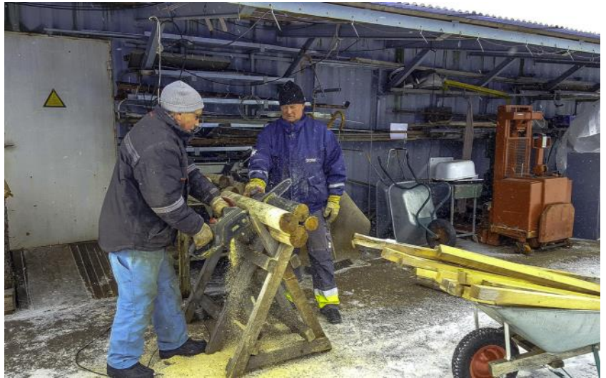
Kaminen i verkstaden har förbrukat mycket ved i vinter