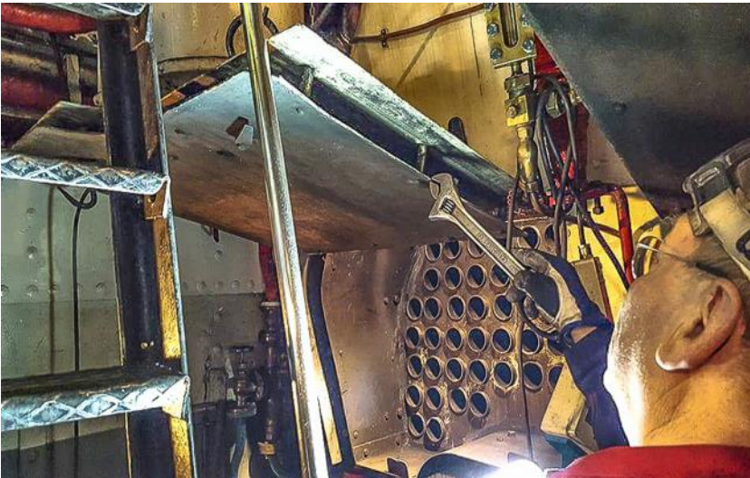
Sotskåpsluckorna riktas och tätas