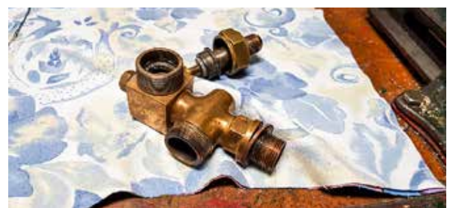
Delar till vattenståndsmätaren i ångpannan.