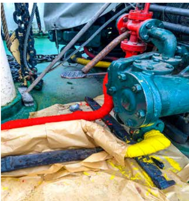
Färgmärkta rör till ångdrivna Ankarspelet.