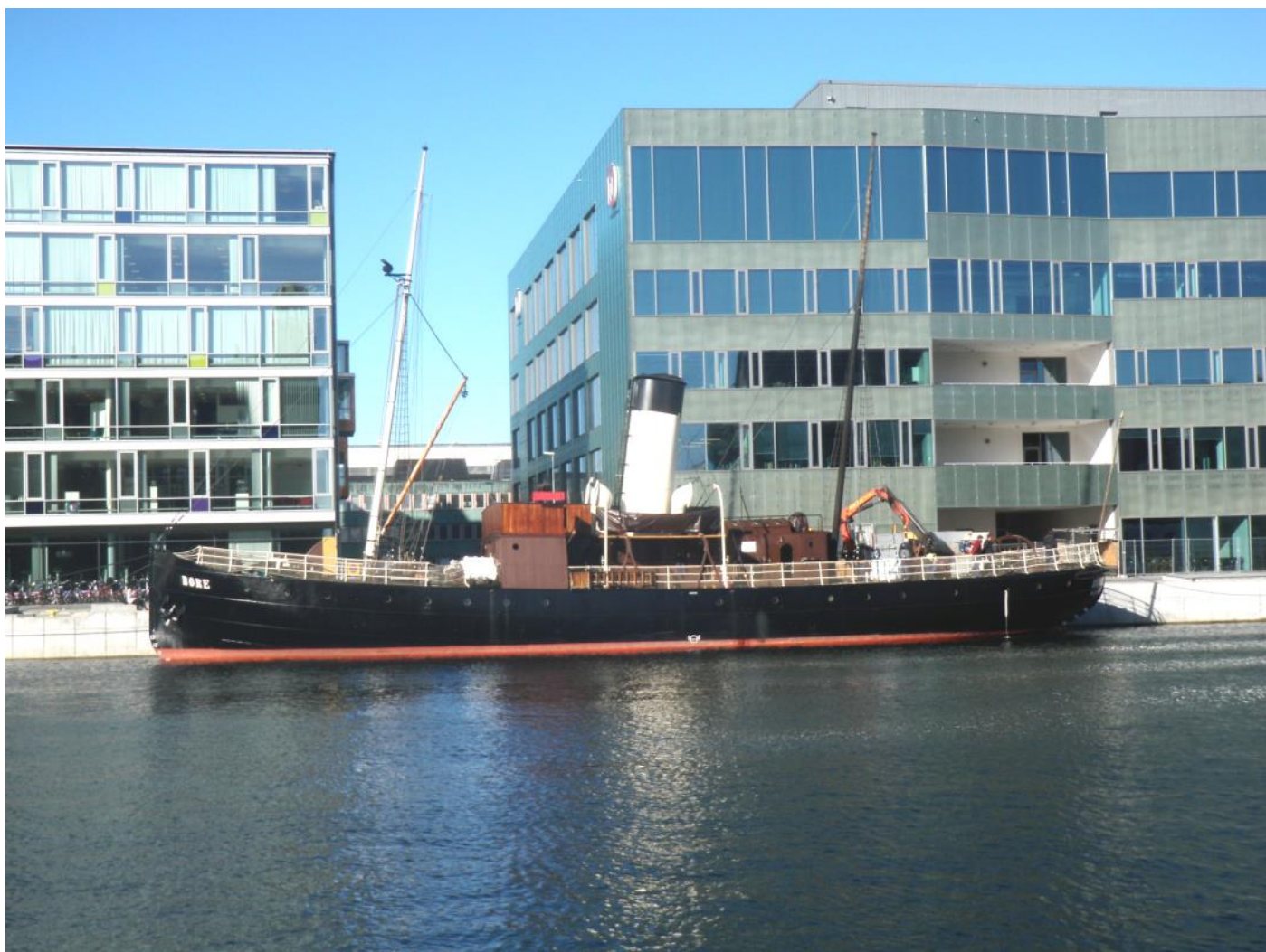
S/S Bore i Malmö