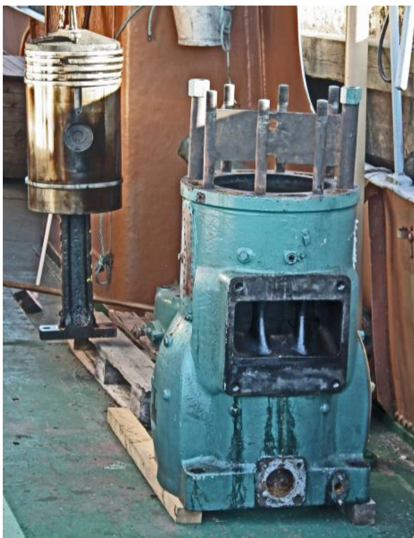
En kolv med vevstake och en cylinder i närbild