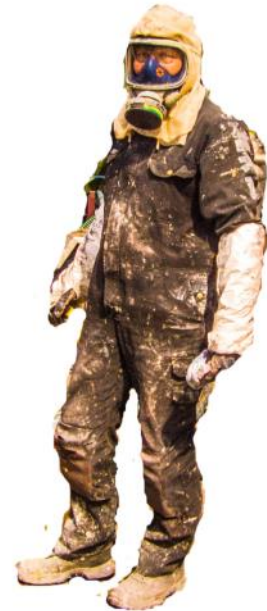
Väklädd målare från Corronix