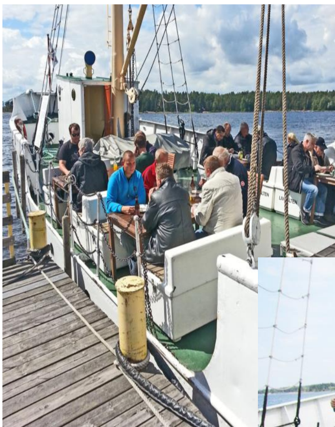
Folket från Saneringstjänst avnjuter en måltid vid Långholmsbryggan. Ovan.

Ett viktigt moment under säkerhetssturen är att träna ankring. Här körs ankarspelet och allt går perfekt. T.h.