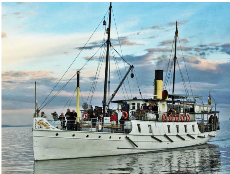
S/S Trafik, "årets arbetslivsmuseum" 2013