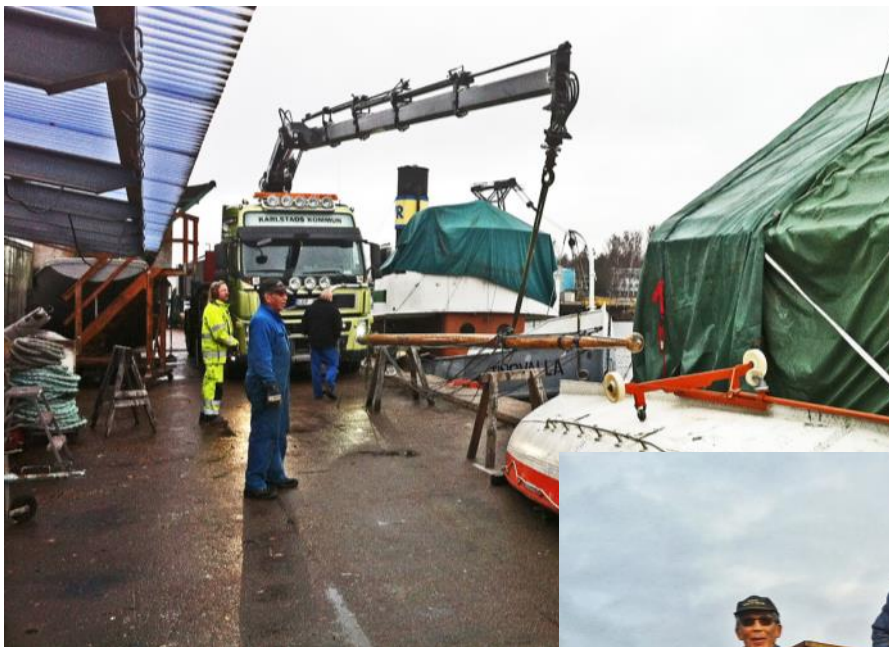
Ovan; Tingvallas mast lyfts ner för underhåll.