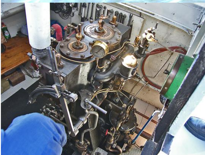
Ångmaskinen i Harge

NÅGRA AV VÅRA MEDLEMMAR är, som omnämns i ledaren, engagerade i ett par intressanta privata projekt. Ångbåten Harge och en hydrokopter.