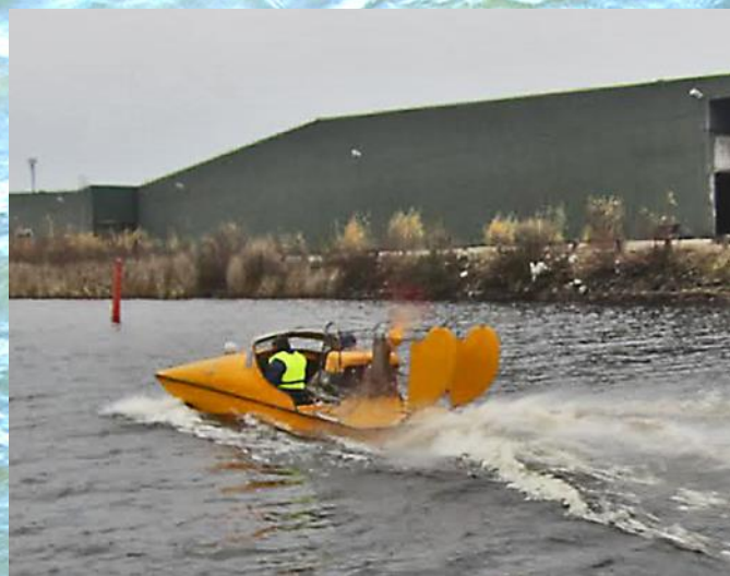
Hydrokoptern på provtur